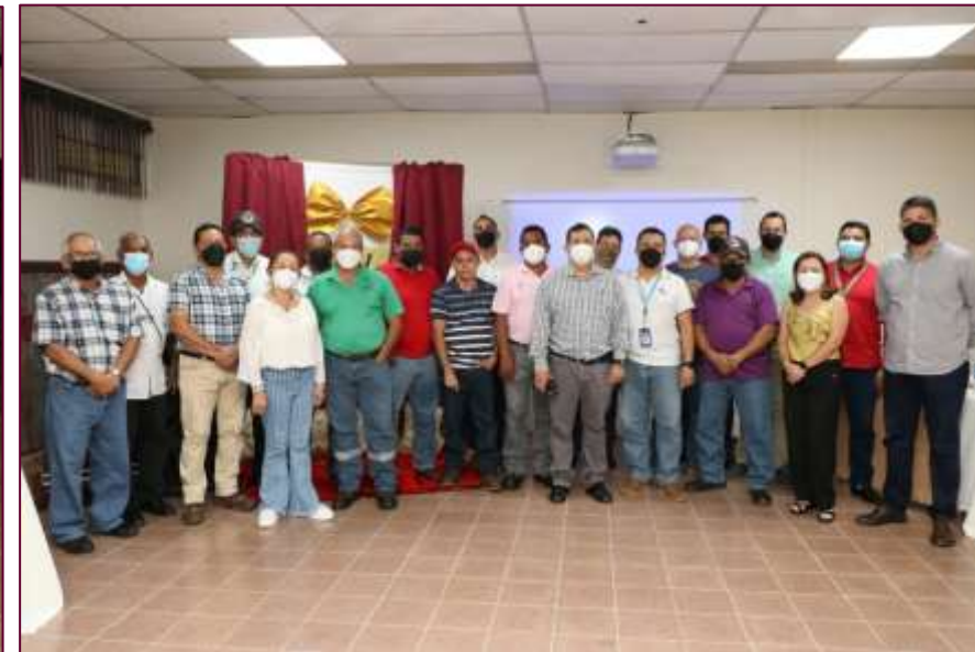
Reconocimiento a colaboradoras en Día del Auxiliar