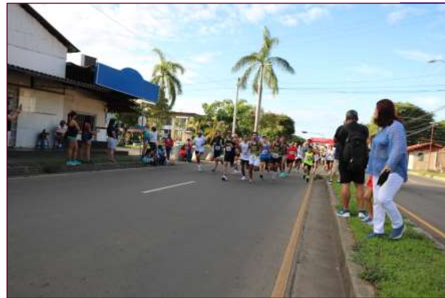
Primera Carrera Caminata UTP 5K